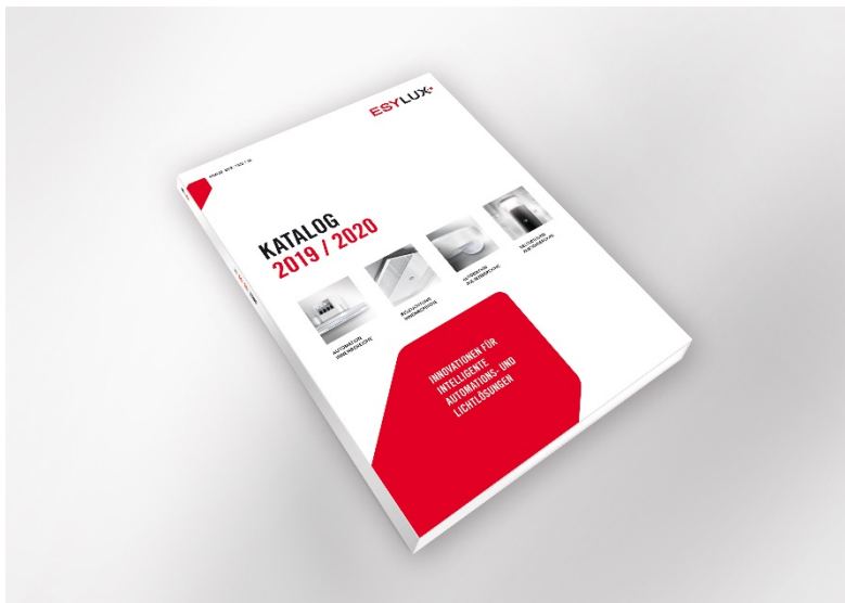
ESYLUX Katalog 2019/2020